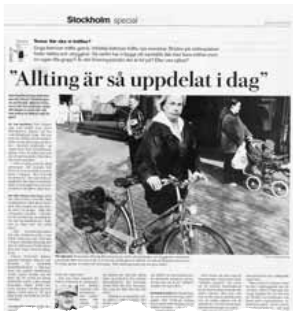
Temasida från Skärholmen den 2 maj 2002 – en diskussion om varför det är så svårt att mötas.