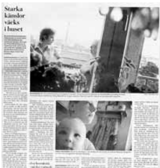
Grannkonflikten i Östberga diskuterades i DN den 22 augusti 2001.

Kommunikation kan ha olika syften. Ett är att utöva makt – att övertala, skrämma, besegra, manipulera – eller att helt enkelt få sin vilja igenom. En annan är att utbyta tankar, känslor och erfarenheter, att hitta kompromisser, att bygga förtroenden och ömsesidig förståelse. Jürgen Habermas teorier utgår från att det i en ”ideal samtalssituation” är möjligt att nå ett rationellt samförstånd (eller konsensus) om vad som är rätt – både när det gäller hur verkligheten ser ut och vad som är etiskt riktigt. Det ideala samtalet är maktfritt: ingen får dominera över den andre, ägna sig åt själv-