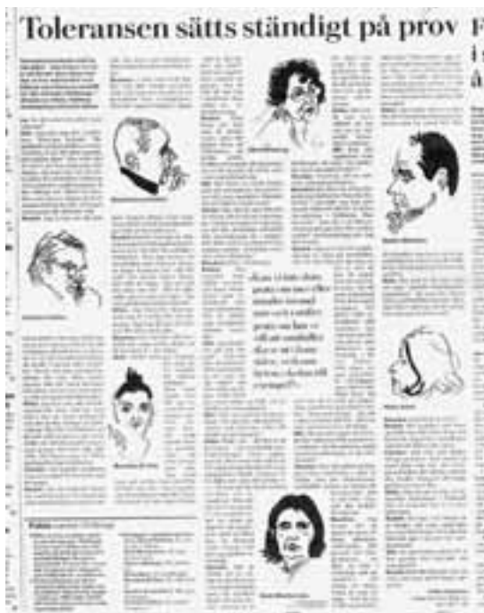
Läsarpanelen i Östberga diskuterar slöjor, flyktmottagning och korta kjolar på en temasida om intolerans i januari 2001.

rätsida på samhället; vad de hoppas och strävar mot.” 4 Och det kräver frågor som tillåter intervjupersonen att tveka, vara okunnig och säga emot sig själv utan att bli bortgjord. Att hålla fast i självmotsägelserna, och inte släta över dem är i själva verket ett bra sätt att nå djupare: ”Hur menar du? Nyss sa du så där och nu säger du så här. Hur går det ihop?” Inte för att sätta dit folk, utan för att komma närmare de faktiska värderingskonflikter som gör det svårt för folk att ta ställning. Där går det att hitta den problemformulering som sätter fart på diskussionen.